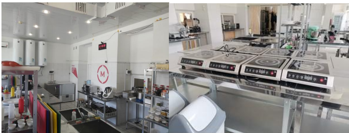
Учебная кухня ресторана (мастерская) по компетенции «Поварское дело»

В учебной кухне ресторана-в центре проведения демонстрационного экзамена по компетенции «Поварское дело», с зонами для приготовления холодных, горячих блюд, кулинарных изделий, сладких блюд, десертов и напитков осуществляется подготовка студентов по специальности 43.02.15 «Поварское и кондитерское дело».